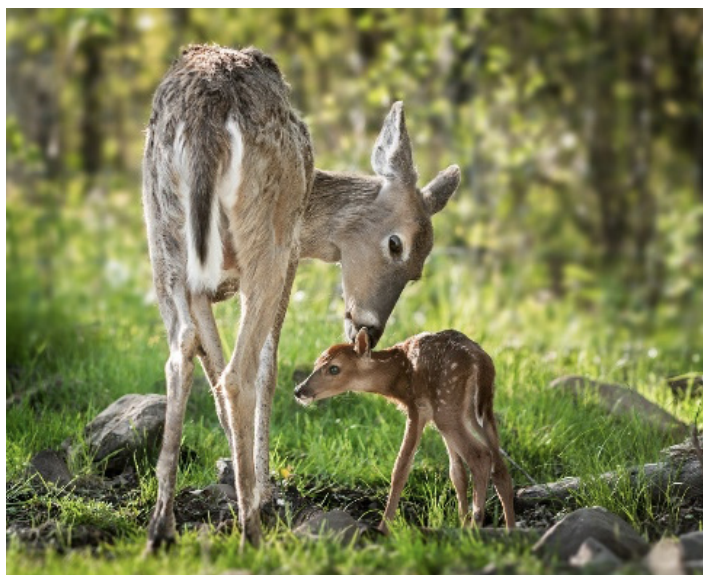
LE CERF - LA BICHE - LE FAON