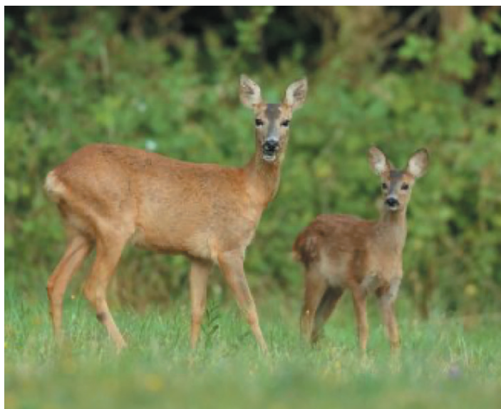
LE CHEVREUIL - LA CHEVRETTE - LE FAON