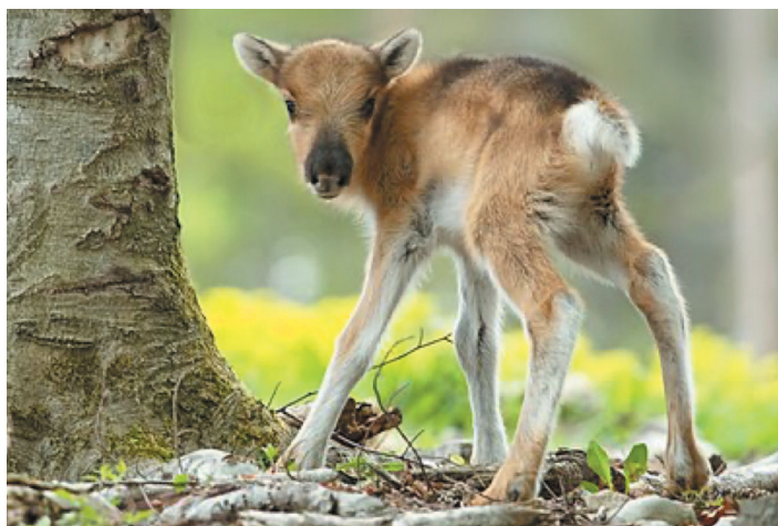
LE RENNE - LE FAON

Régime alimentaire : végétarien (herbivore)